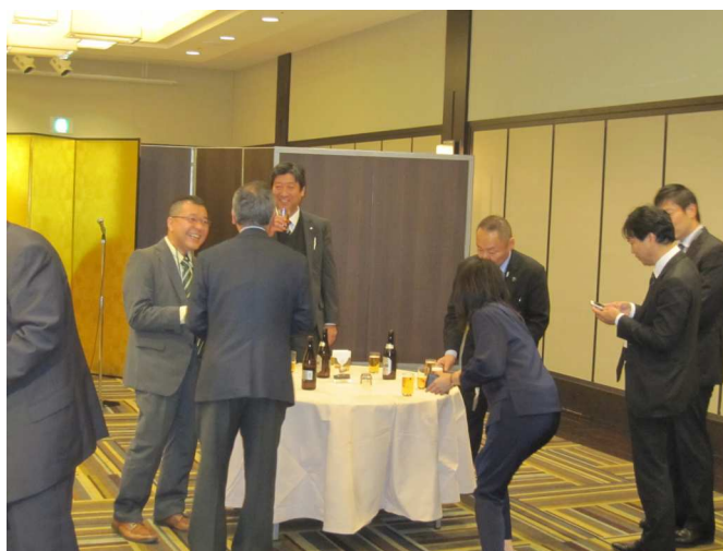
交流会の様子 ステーションホテル小倉「豊饒」