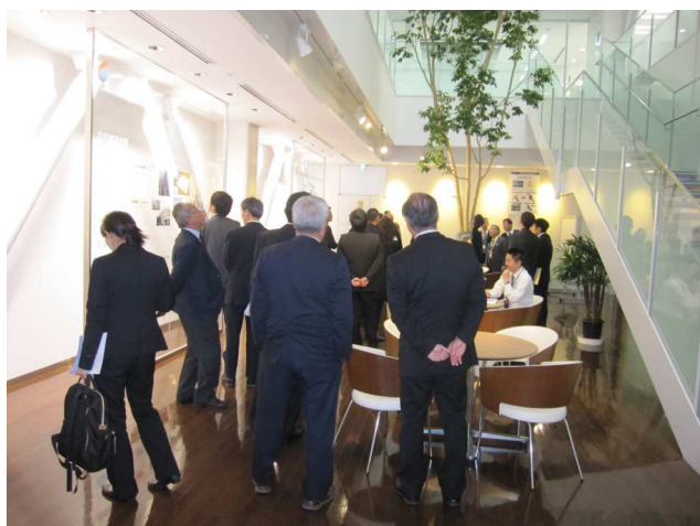
北九州技術センターE館内部の見学

それから、「北九州技術センターE館」の見学ですが、5階建ての白い建物の中に入ってみると、とにかく明るく、心地よい空気が感じられました。ここには、社員約800名が勤務しており、最大900人が収容可能とのことでした。2030年までにビル全体の年間CO 2 排出量を概ねゼロとするゼロエミッションビルの実用化を目指しています。1階から屋上まで、綿密に計算された温度管理や空調機能には感動しました。