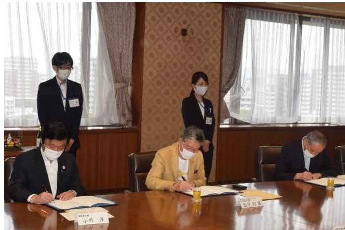
（写真）締結式の様子