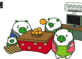
福岡県広報部長 「エコトン」

TEL:052-890-9055 FAX:052-890-9056 E-mail:nagoya-o@pref.fukuoka.lg.jp