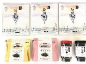
「福岡有明のり 初摘み海苔セット」 「DOCOREメール便セット」