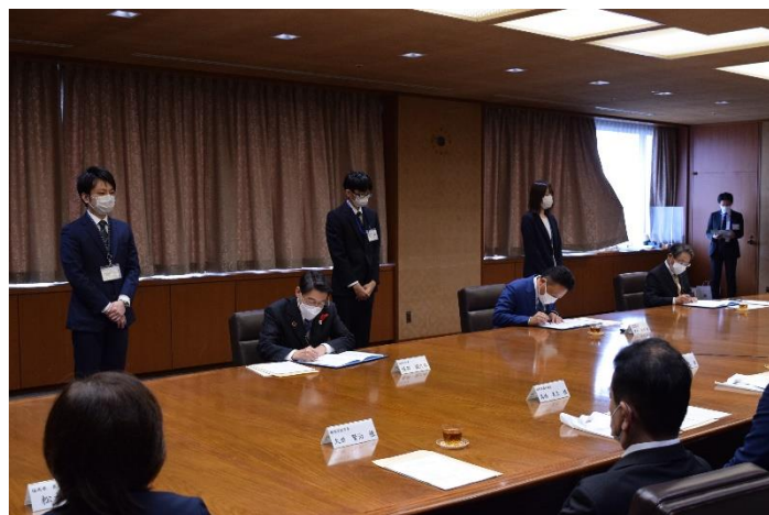
(写真)締結式の様子